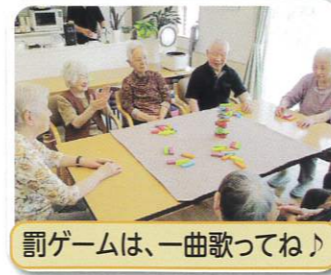
罰ゲームは、一曲歌ってね!