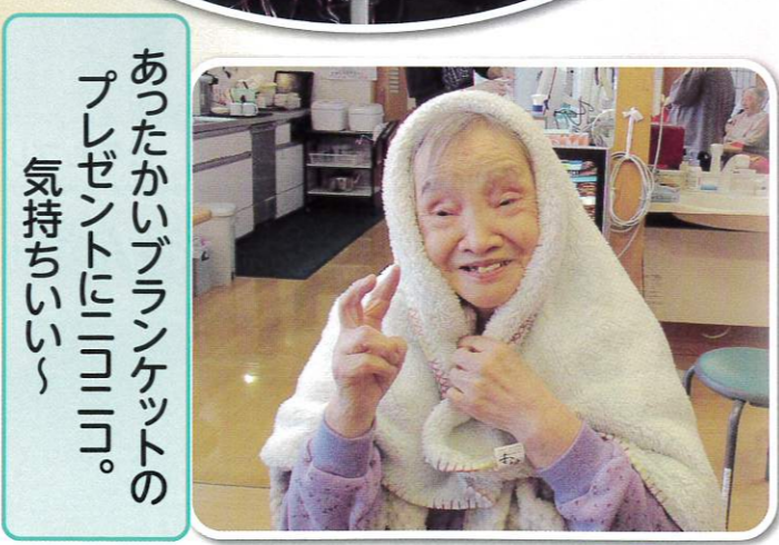
あったかいブランケットの プレゼント「ヨリヨリ」。 気持ちいい〜