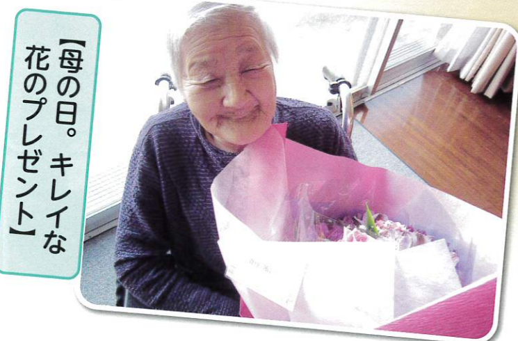
【母の日。キレイな 花のプレゼント】