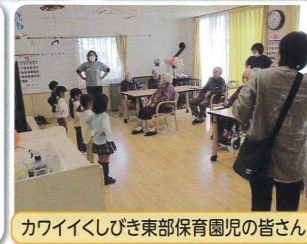
カワイいくしびき東部保育園児の皆さん