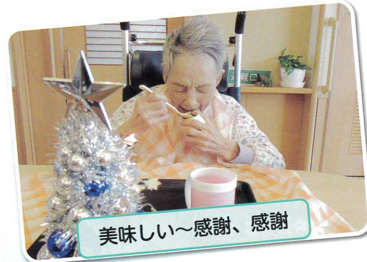
美味しい〜感謝、感謝