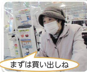
まずは買い出しね