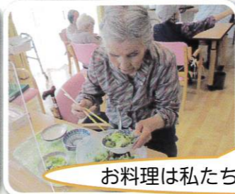
お料理は私たちにまかせなさいね!