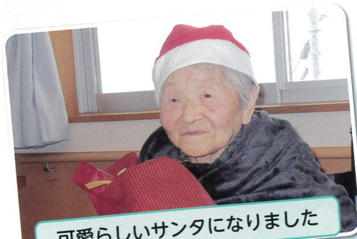
可愛らしいサンタになりました