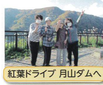
紅葉ドライブ 月山ダムへ