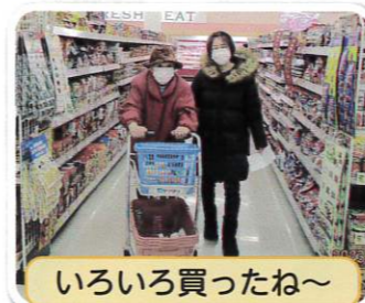
いろいろ買ったね~