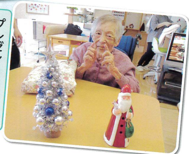
プレゼントもらえて もっしえがった〜