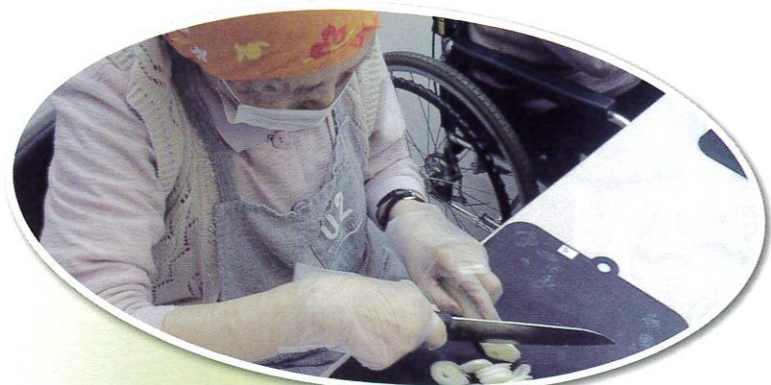
ユニット恒例 芋煮会の調理の様子