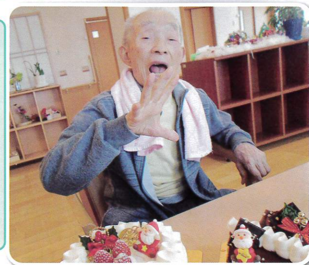
「くんげーもかいねー」