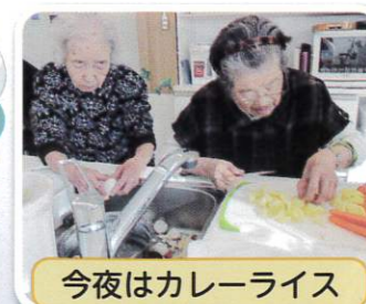
今夜はカレーライス