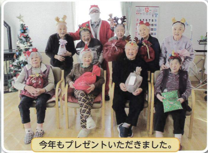
今年もプレゼントいただきました。