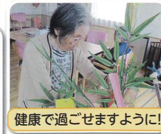
健康で過ごせますように!