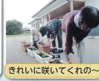
きれいに咲いてくれの〜