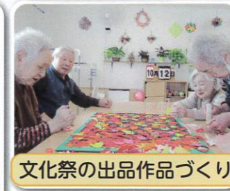
文化祭の出品作品づくり