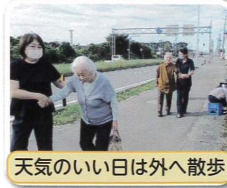
天気の良い日は外へ散歩