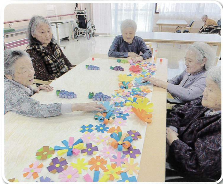
くしびき文化祭への出展作品