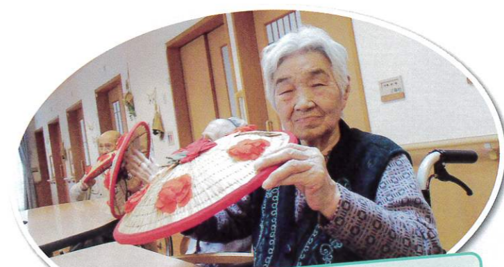
プチ夏祭り！久しぶりの花笠音頭