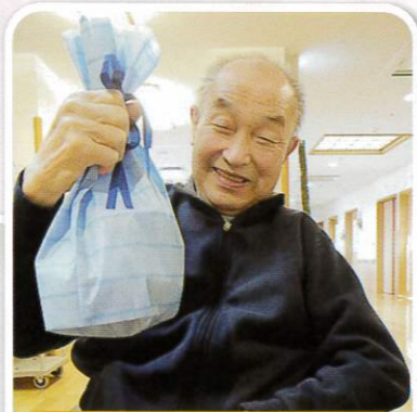
誕生日おめでとう