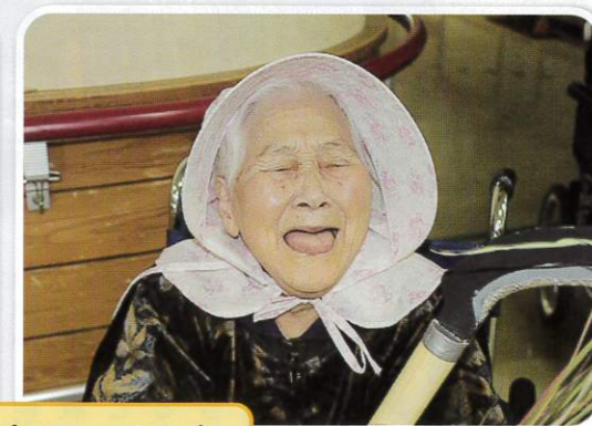
文化祭 (写真コーナー)