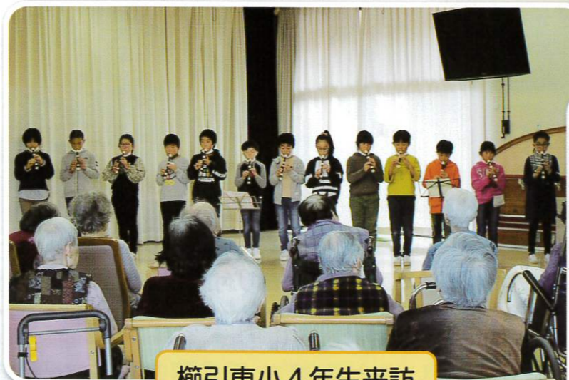
櫛引東小4年生来訪