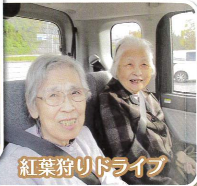
紅葉狩りドライブ