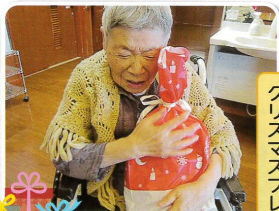
クリスマスプレゼントにっこり