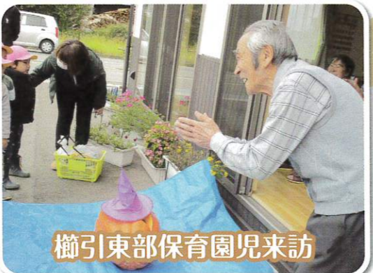
櫛引東部保育園児来訪