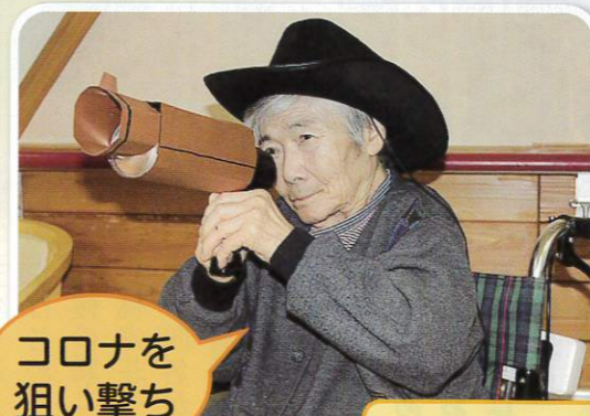
コロナを狙い撃ち