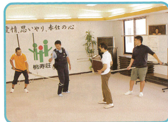
不審者対策講習会