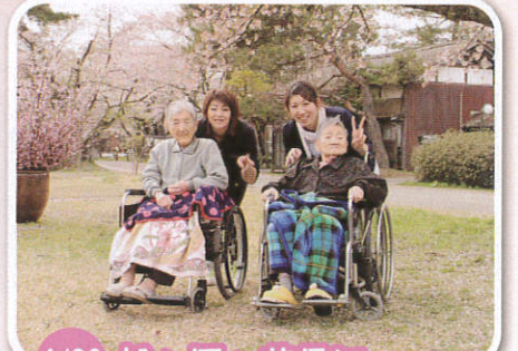
4/20 松ヶ岡へ花見に 行ってきました。