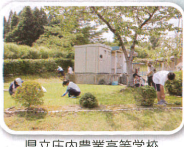
県立庄内農業高等学校 櫛引／朝日地域父兄、生徒 様