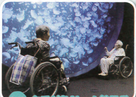
9/2 クラゲドリーム館見学