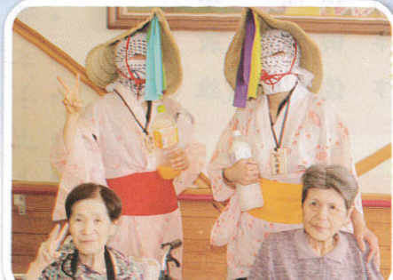
5/25 天神祭の化けものと 「ハイ、ポーズ!」