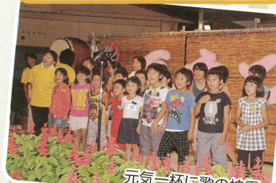
元気一杯に歌の披露