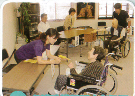
7/7 参議院議員不在者投票