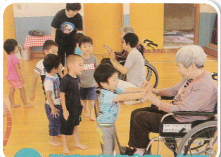
7/11 榊引西部保育園へ訪問