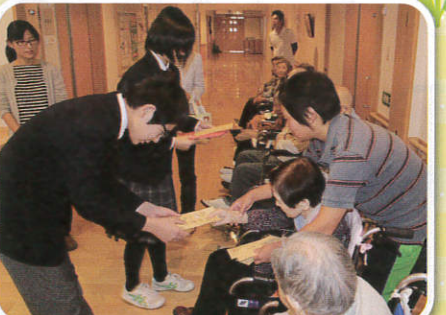
10/31 鶴岡第三中学校生徒へ 合唱のお礼に種をプレゼント