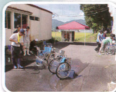
JA庄内たがわ櫛引支所 様