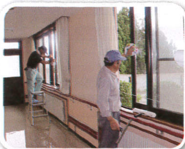
鶴岡市シルバー人材センター櫛引地域 様