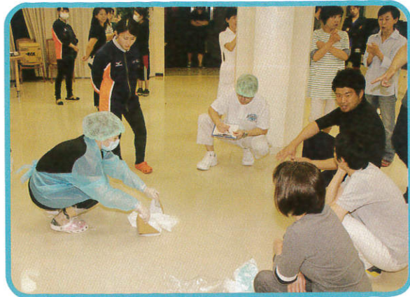
感染症（ノロ）研修会