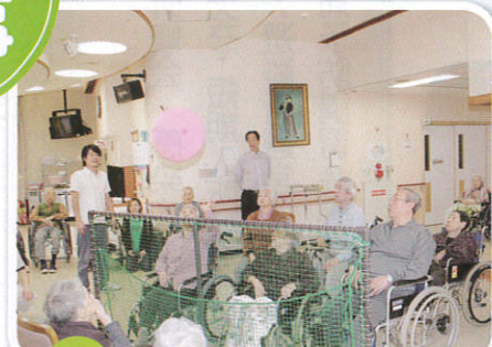
2/15 風船バレーボール大会