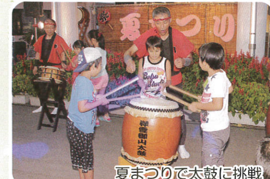
夏まつりで太鼓に挑戦