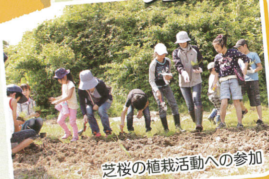
芝桜の植栽活動への参加

今年は、そんな児童の皆さんから桃寿荘で行われた『芝桜の植栽活動』や『夏祭り』に参加をいただき、入所高齢者との交流をともし親睦を深めていただきました。その様子を紹介いたします。