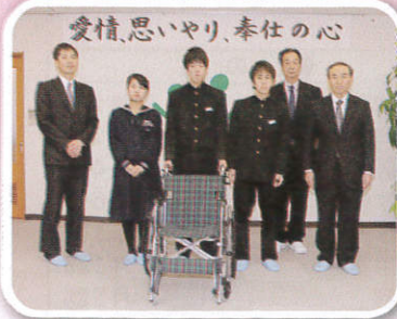
櫛引中学校生徒会 様