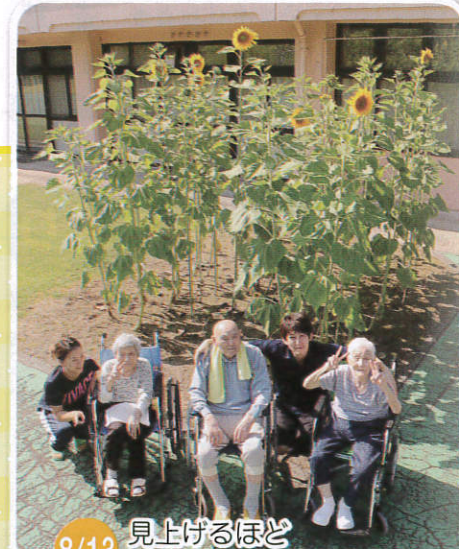
8/13 見上げるほど 大きく成長しました。