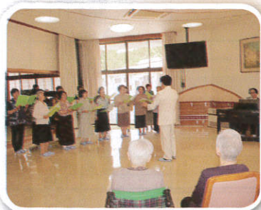
女性サークル「つわぶき」様