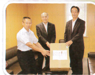
庄内地区郵便局長会 鶴岡第三部会 様