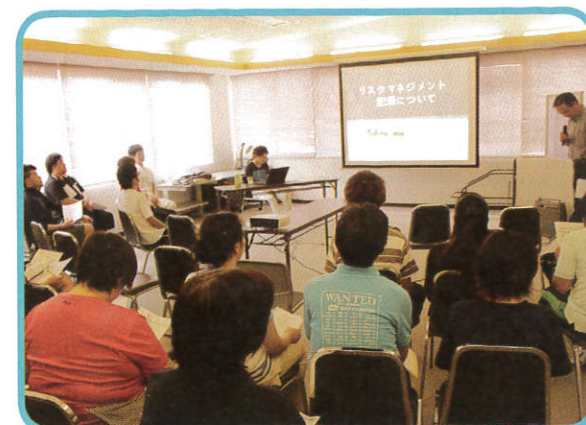
リスクマネジメント研修会

【開催の内部研修会】 介護学習会・リハビリ研修会・感染症（ノロ）研修会・胃ろう研修会 嚥下研修会・看取り研修会・短期入所接遇研修会・身体拘束ゼロ研修会 防災研修会（夜間火災／避難所運営／地震時の応急手当／不審者対策） 心肺蘇生法講習会・腰痛予防講習会等々