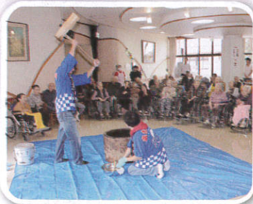
出羽商工会櫛引支所青年部 様