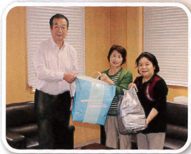
櫛引地域婦人会 様