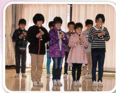
櫛引東小学校3・4年生 様