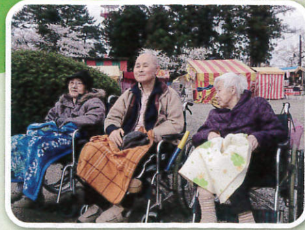
「だんごはね〜なだが?」