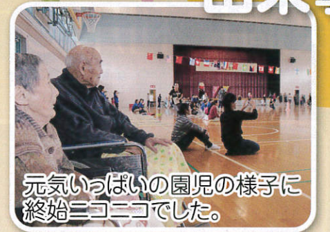
元気いっぱいの園児の様子に終始ニコニコでした。