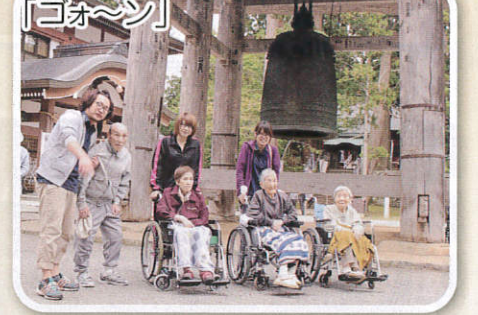
晩秋の羽黒山を参拝してきました。今年は鐘楼の前で記念撮影です。「ゴォーン」