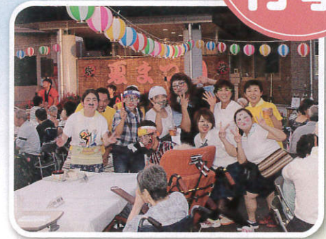
見よ!若い?職員のパワーを!!