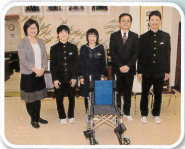
櫛引中学校生徒会 様