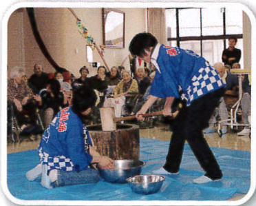
出羽商工会櫛引支所青年部 様