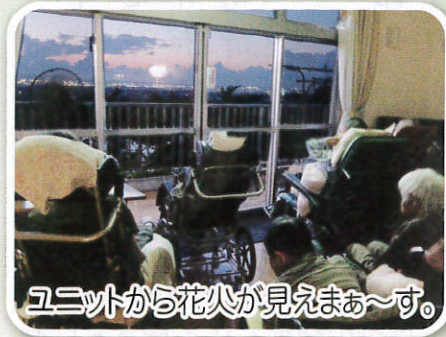
ユニット外から花火が見えま〜す。