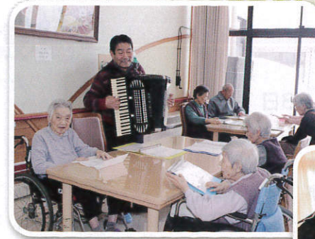
毎週水曜日、アコーディオンに合わせ元気一杯歌っています。