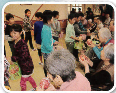
櫛引南小学校4年生 様