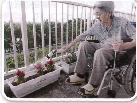
大きく育ててきれいな花見せでの〜。