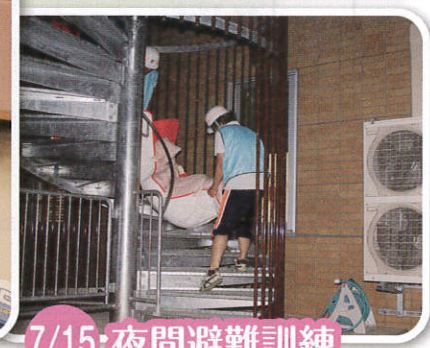
7/15 夜間避難訓練 新棟二階からの避難救出訓練。私たちが皆さんを守ります。