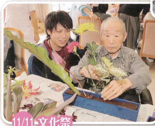
11/11 文化祭 「この花は、このぐれの傾ぎだの。」 「わしの腕前も大したものよ。」