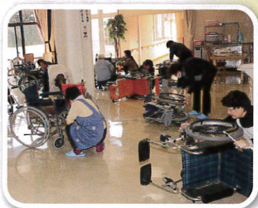
櫛引地区民生児童委員協議会 様