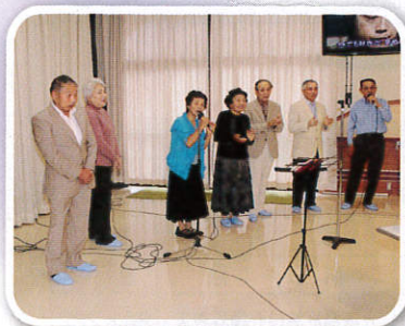
櫛引カラオケ愛好会 様