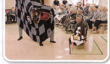
ここ桃平の地にもようやく春の訪れです。