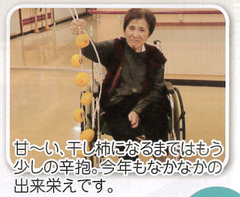
甘〜い、干し柿になるまではもう少しの辛抱。今年もなかなかの出来栄です。