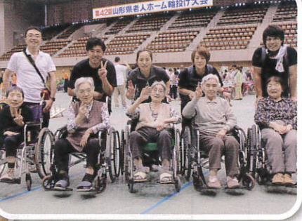
頑張ったけど…。でも、天童までの久しぶりの遠出、楽しかったよ。